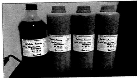
Fotografía 1: Toma de Muestra Puntual